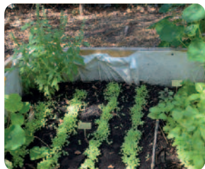
DR - Balade entomologique - copyright : écoferme