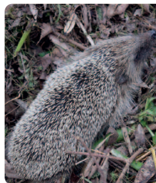
Sauvages de l'écoferme