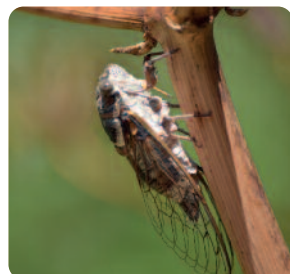
DR - Balade entomologique - copyright : écoferme