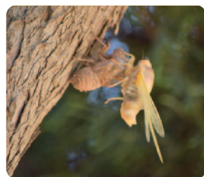
Balade entomologique